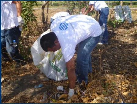
Jornada de Limpieza a lo largo del río Chiquito.