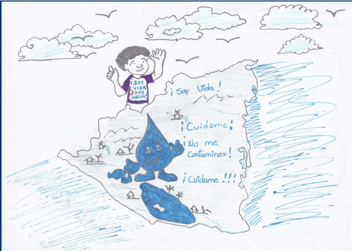
Ganador 6to Grado Concurso: Yo Amo el Agua