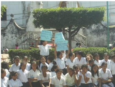
Alumnos de El Viejo, Chinandega Acto de Celebración 22Mar2011