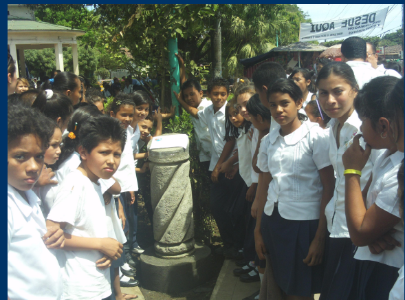
Develacion Monumento al Agua